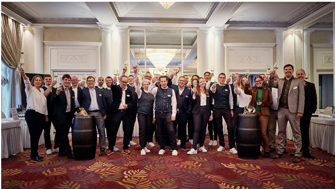
Exzellenz – das Experten-Team von Baur au Lac Vins. (Aufnahme anlässlich der Jubiläumsdegustation zum 180. Bestehen, November 2024)

Expertise allein genügt jedoch nicht bei Baur au Lac Vins. Erst persönliche Begeisterung, Neugier, Freude und echte Leidenschaft für die Wein- und Genusskultur machen den Unterschied - sie verwandeln Kompetenz in Exzellenz.