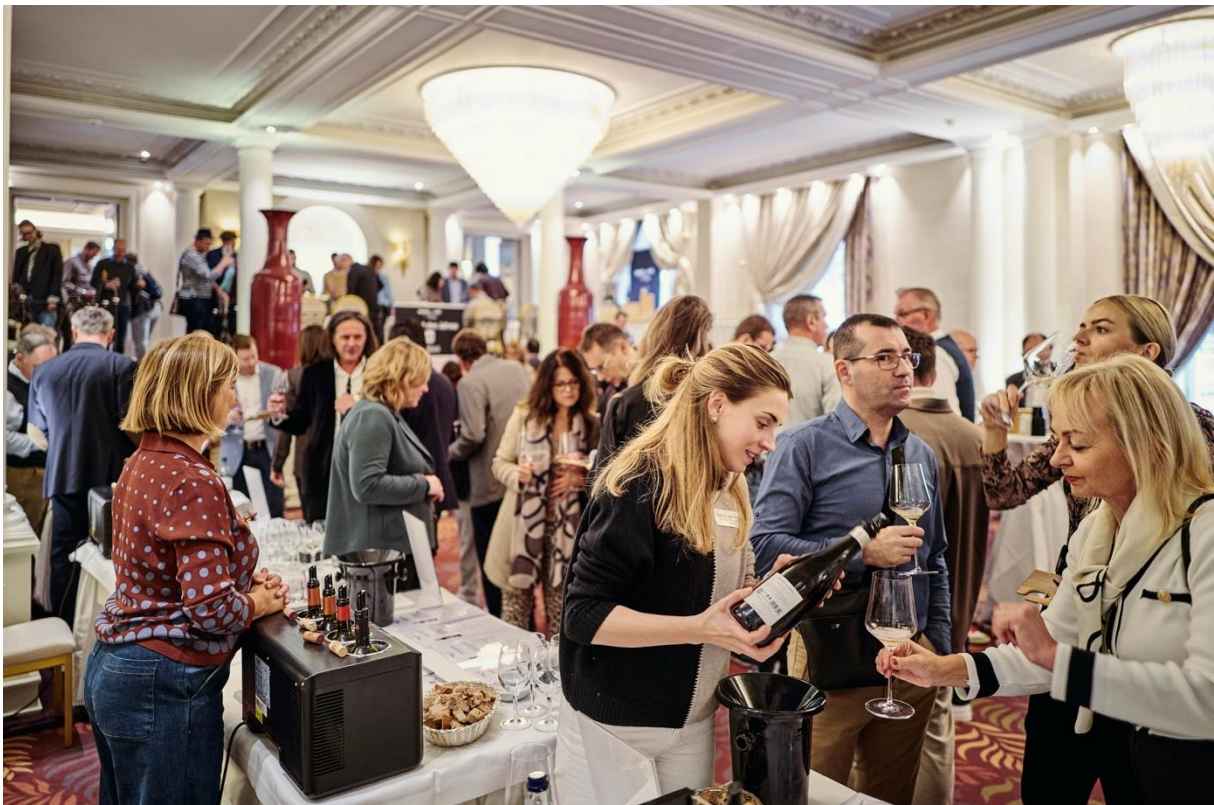
Grosser Andrang bei der Jubiläumsdegustation 2024 im Baur au Lac

Aktuelle Termine: bauraulacvins.ch/de/events