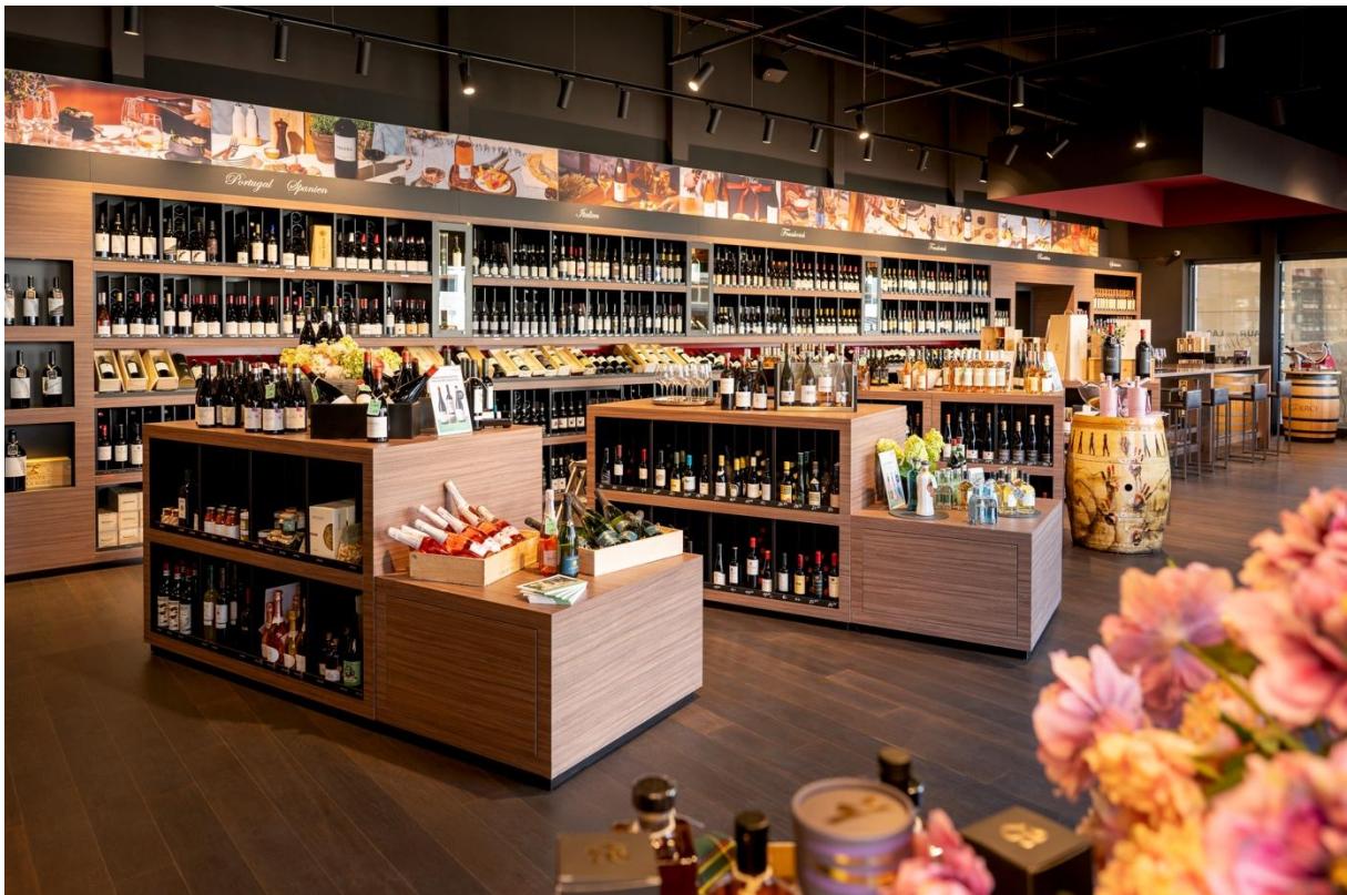
Die Vinothek in Regensdorf ist gleichzeitig Hauptsitz von Baur au Lac Vins.

Ist das Produkt eine absolut überzeugende Neuentdeckung, die alle anderen Faktoren erfüllt, übernimmt Baur au Lac Vins auch die Aufgabe, das Interesse dafür zu wecken.